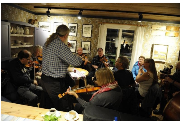
Natt-jam i Hembygdsgården i Sorsele

Några detaljer fick lov att bli annorlunda från förr om åren. Hembygdsgården drivs under ny regi och för att hålla nere kostnaderna så beslöt vi oss att hålla frukosten i egen regi på campingen vilket verkade fungera precis lika bra.