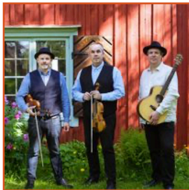
I Fäälän från Lappfjärd Finland Lö 25/5 kl 18.30