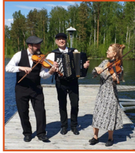
Rällä Uleåborg Fre 24/5 kl 19,00