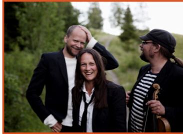
Triakel Lör 25/5 kl 19.00 Hälsingland, Jämtland

”Vi trivs tillsammans med folkmusik i Nordkalotten”