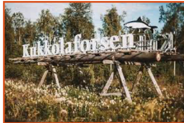
Kukkolaforseen skylten vid infarten

Kukkolaforseen Turist & Konferens anläggning finns i byn Kukkola. Från Haparanda 14,3 km norrut efter riksväg 99. Riksväg 99 följer Torneälv på höger sida av vägen.