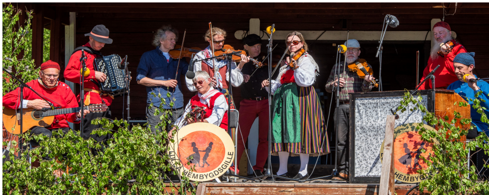
Luleå Hembygds gilles Spelmän

Vuxna 200:-, Barn t.o.m. 16 år gratis Arr.: Luleå Hembygds gille, Norrbottens Spelmansförbund, Nederluleå församling.