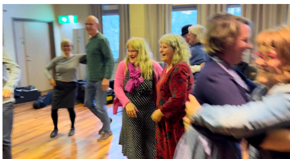
Glädjen stod högt i tak