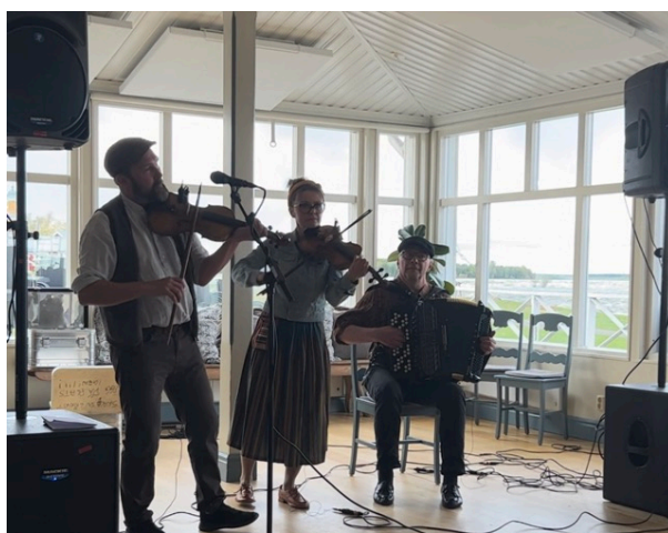
Konsert med Rällä