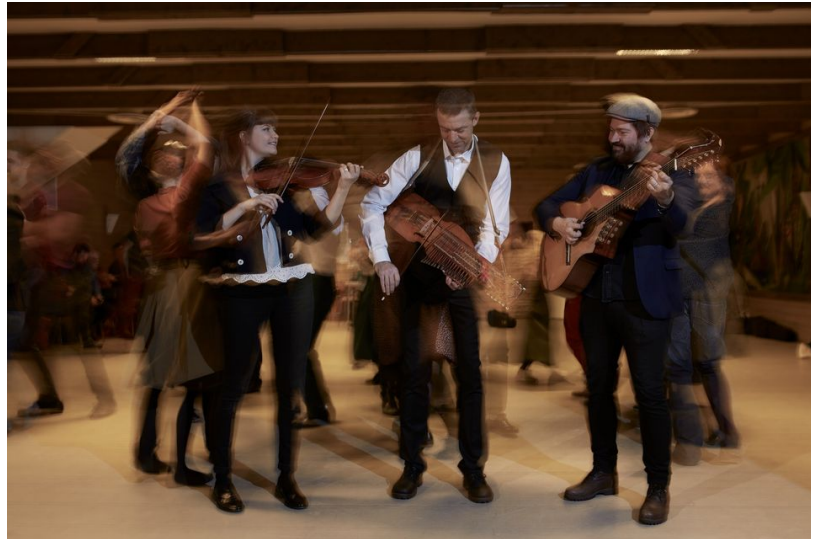
Ahlberg, Ek & Roswall höll en bejublad konsert.