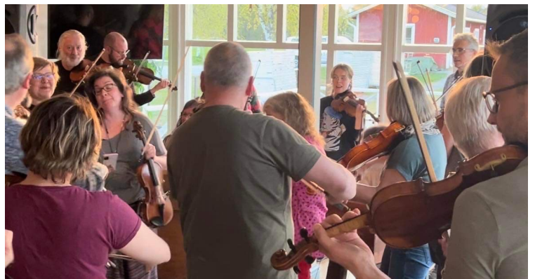
Storjam och gemenskap!