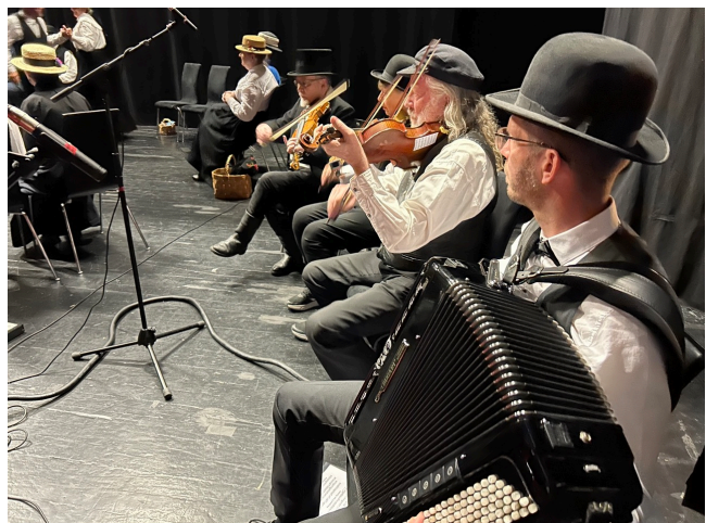
Musiker från Luleå Hembygds-gille spelar till Herrskapsdansarna