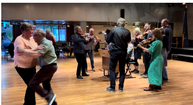
Dansare och spelmän på Haparanda Folkets hus