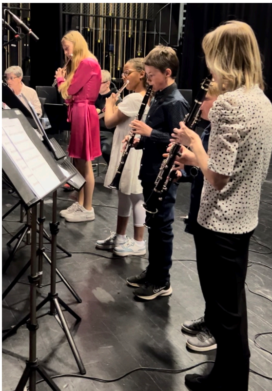
Ungdomar på kurs.