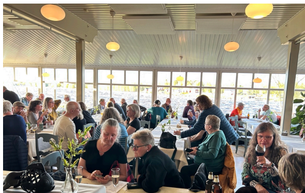
God mat och gemenskap i restaurangen