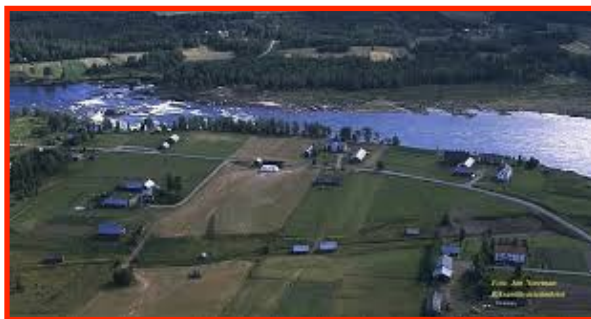
Vy över Matkakoski, Korpikylä Till Matkakoski är det ca 250m från Suogården

Vi följer rekommendationer och eventuella restriktioner för pandemin