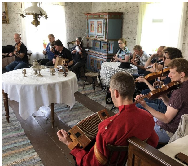
Välbesökt workshop med Mäsä Duo

Lördagen inleddes med olika workshops, däribland en välbesökt sådan där Mäsä Duo lärde ut ett par finska låtar. Noter till dessa två låtar bifogas detta medlemsblad.