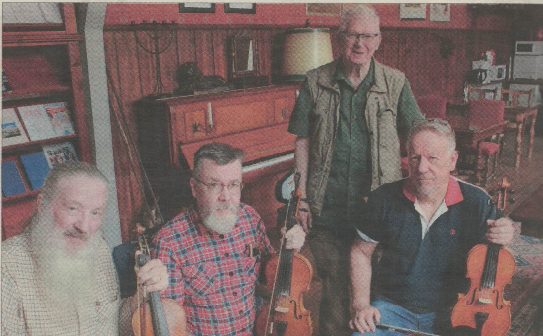
En låtskatt, så beskrivs innehållet i nothäftet som spelmännen producerat. Låtarna har spelats i socknar i Norrbotten och Tornedalen under senare delen av 1800-talet och under tidigt 1900-tal.